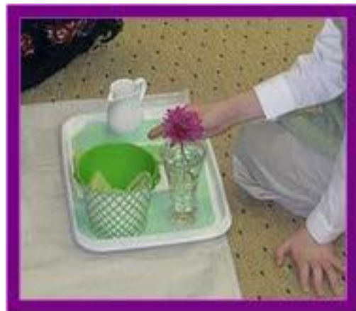
Un copil aranjând florile în vază

Unui copil care lustruiește cu atenție o icoană de argint, îi place să aibă grijă de lucruri și să le înfrumusețeze.