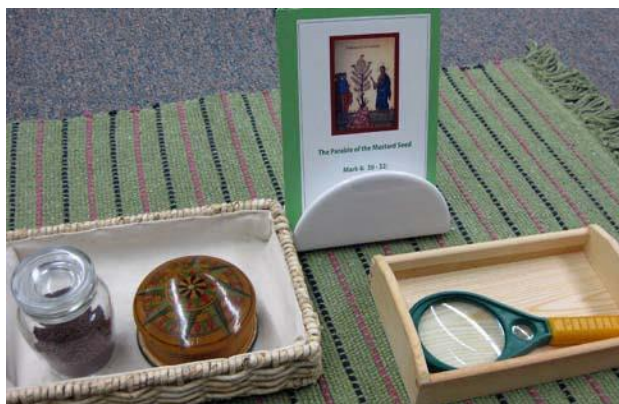
Pilda grăuntelui de muștar

Pildele sunt prezentate pe rând, pe parcursul anului. Copiii repetă adesea activitatea practică corespunzătoare fiecăreia în parte. După ce ascultă citirea Evangheliei, ei caută cea mai mică sămânță și observă cum aluatul crește sub acțiunea drojdiei, prezentându-li-se astfel pildele lui Hristos într-un mod concret, care le permite să mediteze asupra tainelor Împărăției Cerurilor la nivelul lor de înțelegere.