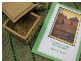
Pilda omului care aruncă sămânța în pământ