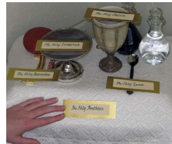
Model de Procomidiar