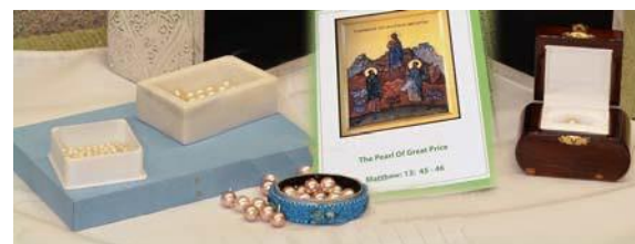
Mărgăritarul de mult preț