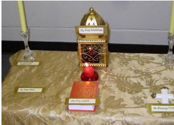
Un exemplu de Sfântă Masă

Copiilor le place să atingă obiectele asemnătoare obiectelor liturgice și să le spună numele.