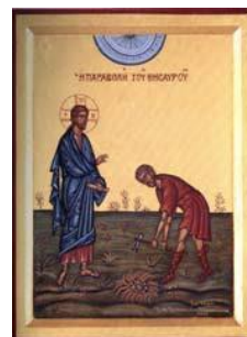
Împărăția lui Dumnezeu și comoara ascunsă